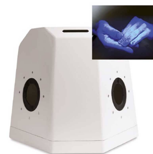
Caisson pédagogique lavage des mains

Les patients ont été sensibles au bien-être procuré par ces gestes simples.